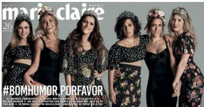
FIGURA 1: Capa Marie Claire Brasil Edição 313 - Abril de 2017.

-brancas e como confrontam “representações, evidências e pressupostos narrativos implícitos” (ABRIL, 2007, p. 62).