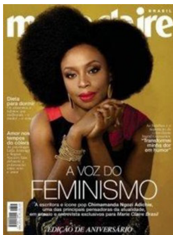
FIGURA 2: Capa da Marie Claire Edição 337 – Abril de 2019.