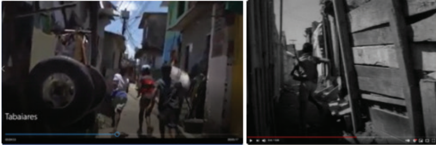
Figura 6: Fuga em Tabaiaries e Couro de Gato