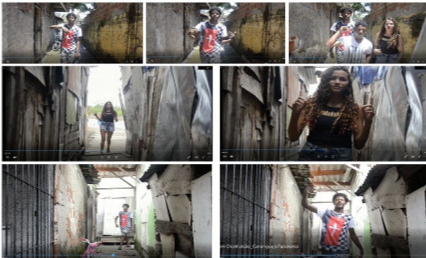
Figura 4: Jovens que vem de encontro à câmera em Sem Destruição

Em Sem Destruição , no formato de videoclipe, os corpos da juventude também se movimentam em busca da câmera. Os jovens vêm ao encontro da câmera, e com isso crescem no quadro, pelos becos da comunidade, declarando diante das lentes um discurso crítico de afirmação. Letra cantada no momento da Figura 4: “Sou do Caranguejo, prazer, satisfação / Aqui é minha favela e vou fazer revolução / Sem essa de promessa, comigo não rola não / Aqui na comunidade não falhamos na missão”. Essa vinda à câmera partindo do fundo do beco, buscando e se aproximando da câmera, se repete outras vezes na coreografia do clipe de forma ainda mais marcada. É como se houvesse uma afirmação de que esses sujeitos não são elementos que apenas compõem o quadro/território, mas que esse território lhes pertence. Pertencimento reafirmado várias vezes na letra do bregafunk , e que aparece plasticamente na estética do vídeo e na auto-mise-en-scène destes jovens. Em Sem Destruição , é na relação com a câmera que isso fica manifesto, precisamente na forma de vinda à cena destes jovens.