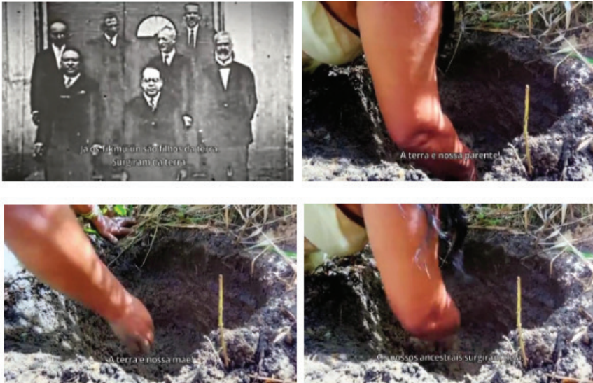
Figura 2: Diferentes trechos do filme mostram o modo de relação do povo Maxakali com a terra: a terra é mãe, sua parente, sua ancestral, de onde vem sua cultura e religiosidade.

Trata-se, pois, de duas relações muito distintas com a terra – enquanto nas comunidades tradicionais a terra-divindade era quase um “início e um fim” em si mesma, formando um corpus com o homem, nas sociedades estatais a terra se transforma gradativamente num simples mediador de relações sociais, onde muitas vezes o “fim” último, como na leitura hegeliana, caberá ao Estado. (HAESBAERT, 2004, p. 136, grifos do autor).