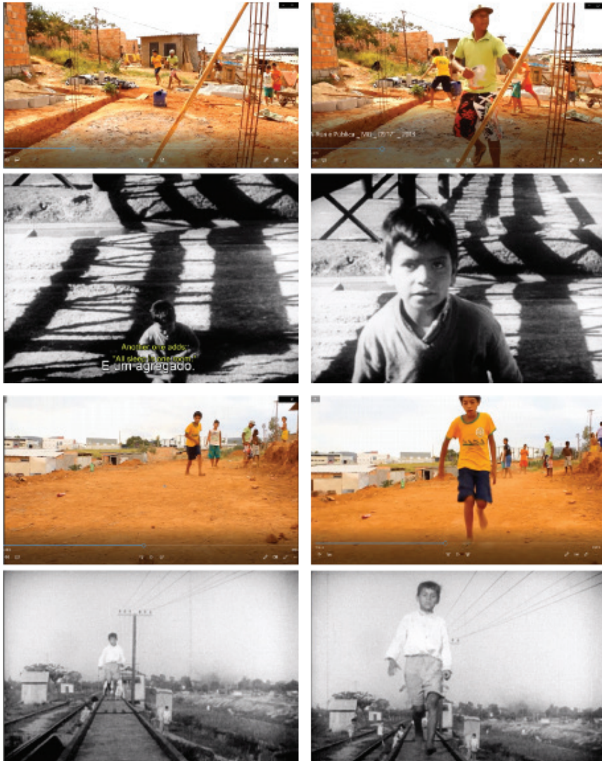
Figura 3: Crescer no quadro em Tiré Dié e A rua é pública

do quadro. Algo semelhante ocorre algumas cenas depois, quando os meninos finalmente acham um local propício para jogar futebol, um deles vem até onde está posicionada a câmera para fazer a marcação da barra com os próprios pés. O menino vestido de amarelo “cresce” no quadro à medida que corre em direção à câmera.