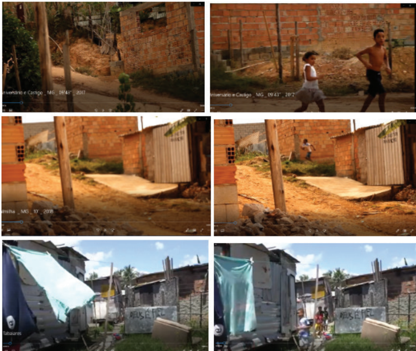
Figura 1: Crianças correndo nas aberturas de Aniversário e Castigo , Palmilha e Tabaiaries , respectivamente

espaço vazio, surge a criança que corre e dá movimento à cena. Desta vez, sabemos ou saberemos ao longo do filme os desejos das personagens a partir de suas expressões e encenações. Também em Tabaiaries , logo após os créditos iniciais, da imagem das moradias cortadas por um beco vazio, cujo único movimento é do vento que balança as roupas no varal, surgem as crianças correndo (Figura 1).