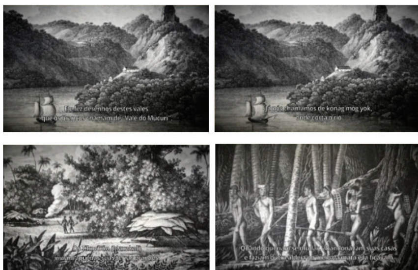
Figura 1: Sequência inicial do filme que nos mostra uma outra relação com esse território ancestral e a forma como os Maxakali tiveram que ressignificar essa forma de se relacionar com esse território.

Outro aspecto importante de ser, de antemão, sinalizado é a forma como o filme nos apresenta muito mais que a resistência desse povo aos anos de colonização: através da narrativa fílmica nos são apresentadas suas memórias como a principal arma de sobrevivência e resistência.