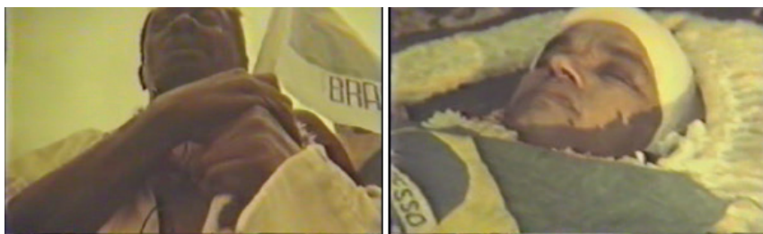
Figura 3: Frames do filme Exu-Piá , aparecem Otelo e Garrincha (sendo velado), respectivamente.

Em Exu-Piá , ao som de Querelas do Brasil (Aldir Blanc e Maurício Tapajós), o filme registra a morte de Mané Garrincha, entrecruzando as cenas de seu enterro com imagens de diversas personalidades do futebol, e costurando a sequência com uma corrida de Grande Otelo com uma bandeira do Brasil em mãos. Tal sequência é exemplar da posição que Otelo ocupa no filme de Veríssimo. Restaria por se analisar mais detidamente essa posição intercessora do ator e das personagens convocadas: há um trabalho por se fazer de pensar os trânsitos entre o signo neste filme; ou seja, encarnando o avatar macunaímico, diversas personalidades aparecem no filme. Multiplicam-se, assim, as encarnações.