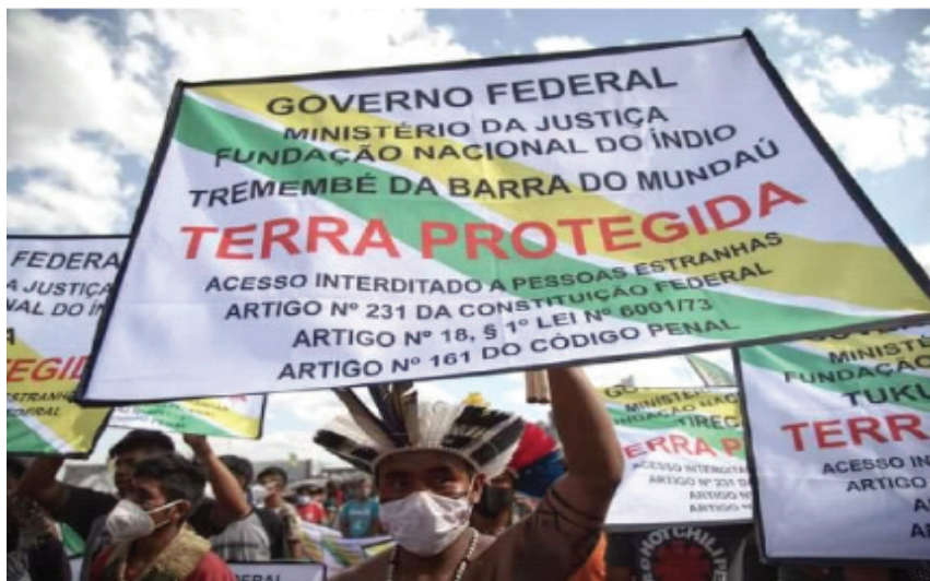
Imagem 6: Na mobilização, os indígenas têm trazido imagens das placas que demarcam seus territórios, como uma forma de autodemarcação, como deveria acontecer. Como relatado no filme Nūhū yāg mū yōg hām: essa terra é nossa! , essas placas não são respeitadas por parte da população.

Se alguém pode nos salvar da situação catastrófica ambiental que estamos vivendo são esses povos. Se alguma coisa pode nos tirar dessa situação social caótica são os seus saberes. Se pretendemos sobreviver enquanto sociedade e coletivo, é fundamental enxergar e valorizar esses saberes, essas formas de relações com os cosmos e com a natureza. Enxergar para além do ver, viver! Se toda a situação que vivemos hoje – como as tragédias ambientais, consumismo desenfreado, degradação e exploração constante da natureza, desequilíbrio ambiental, desigual-