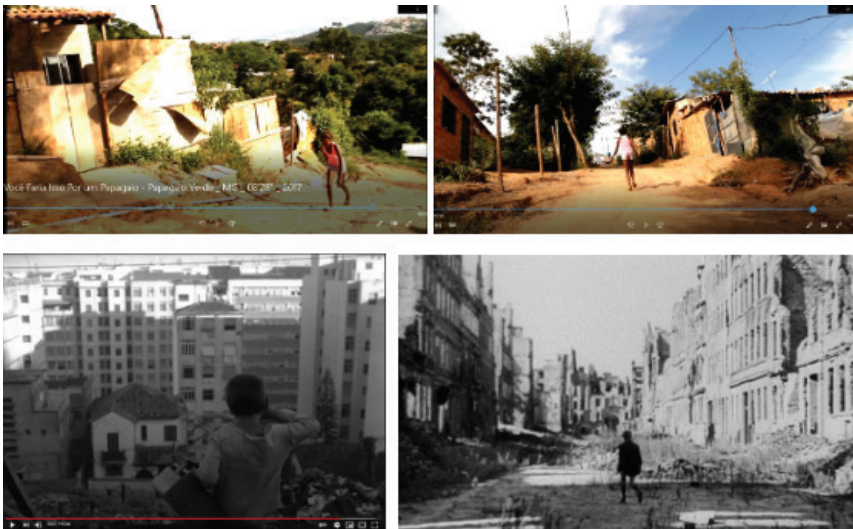
Figura 7: Deambular final em Papagaio Verde , Couro de Gato e Alemanha, Ano Zero

Em relação às outras deambulações, pode-se dizer que a cena final de Couro de Gato dialoga diretamente (e indiretamente, no caso de Papagaio Verde ) com o final de Alemanha, Ano Zero (Roberto Rossellini, 1948), filme integrante da Trilogia da Guerra do diretor, que também inclui Roma, Cidade Aberta (1945) e Paisá (1946). Ao final do filme de Rossellini, Edmund, a criança protagonista, vaga sem rumo pelas ruínas de uma Berlim destruída pela guerra. Sem família, amigos, perspectivas e de futuro condenado, o suicídio do garoto desfecha o filme, tragicamente.