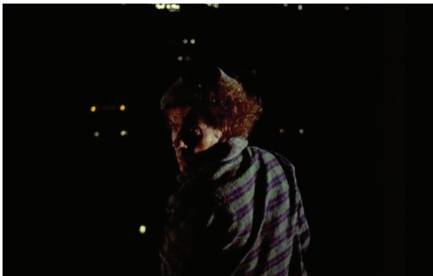
Figura 4: Fotograma do filme Macunaíma , de JPA, em sua única cena noturna

No caso do filme Macunaíma (1969), cabe destacar que, embora a técnica seja um tema fundamental para o filme, predomina a opção de “não dar ênfase à eletricidade”. Assim, o percurso do personagem alia-se “a um imaginário da malandragem dos pequenos golpes à luz do dia” (XAVIER, 2012, p. 239). No único plano em que o mundo elétrico da noite urbana se faz presente, vemos Macunaíma, recém-chegado na cidade urbana, prostrar-se pensativo, um tanto perdido de frente a uma grande avenida. De cima de um viaduto, em direção contrária ao sentido em que seguem os carros, ele é todo silêncio e interrogação – ao que o narrador comenta e esclarece que se trata do choque pré-adaptação e subsequente adesão.