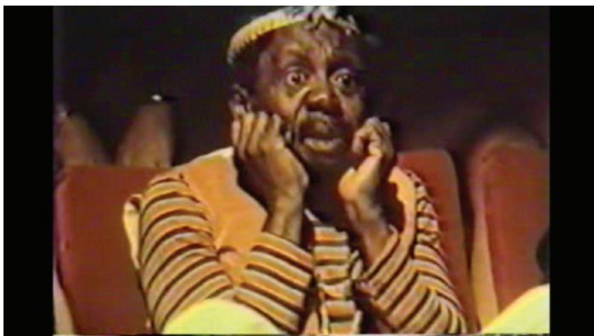
Figura 1: Grande Otelo no filme Exu-Piá assistindo a adaptação teatral de Macunaíma.