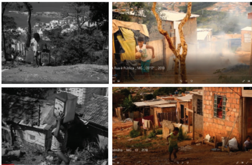
Figura 2: Cenas iniciais de Couro de Gato , Palmilha e A Rua é Pública

Em A Rua é Pública , também na cena inicial, o garoto protagonista vem à cena do fundo da fumaça da ladeira carregando uma bola nos braços. Nas cenas seguintes, o garoto se juntará aos colegas na busca por um terreno adequado para que possam jogar futebol. A primeira cena de Palmilha traz uma criança subindo o morro da ocupação; ao acompanhá-la, o plano nos dá uma visão panorâmica da paisagem do lugar. Por outro lado, nas cenas iniciais de Couro de Gato , vemos as crianças se preparando para mais um dia no morro, carregando tonéis d’água ou preparando o amendoim que será vendido na “cidade”. Uma delas também aparece em cena vinda do fundo de uma ladeira (Figura 2). Ao invés da bola, latas d’água, em vez da palmilha, potes de amendoim a serem vendidos na “cidade”, que vemos do alto do morro. Se nos filmes antes mencionados as crianças correm para chamar os colegas para jogar bola, empinar pipa, ajudar o amigo a sair do castigo ou a amiga a achar uma palmilha, aqui elas se preparam para mais um longo dia de trabalho.