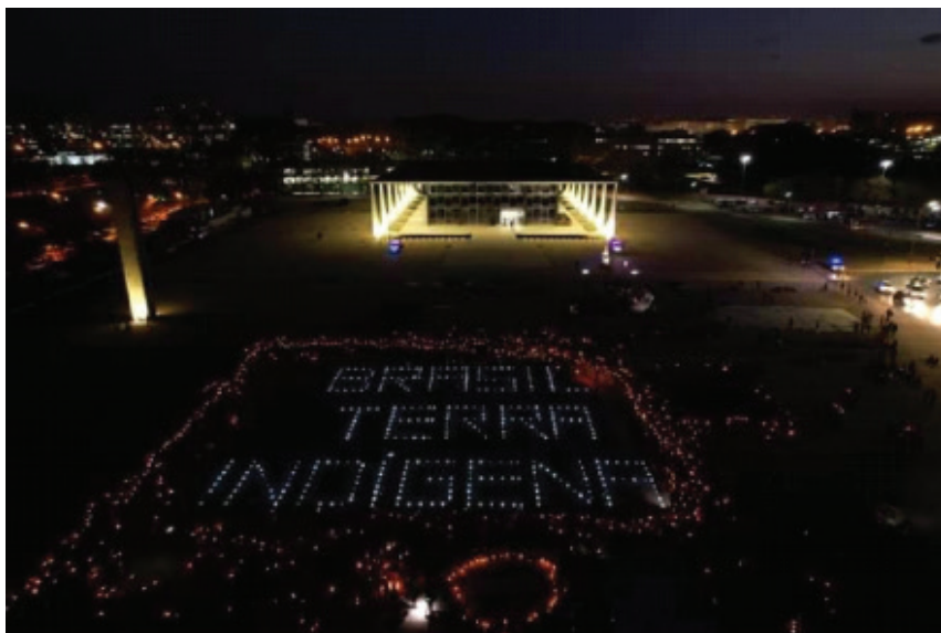
Imagem 7: Uma das imagens mais incríveis que circulou nesses dias: o Brasil é terra indígena. De quem é esse território?