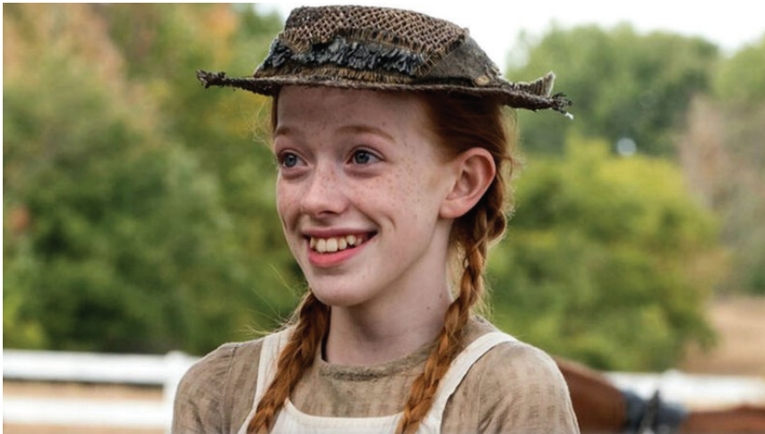
Figura 2: A personagem Anne Shirley-Cuthbert na primeira temporada da série.

ruivos como sua “tristeza ao longo da vida”, comumente associados, pela comunidade, ao seu temperamento – em um movimento que evidencia a constante relação, feita socialmente e retratada na produção audiovisual, entre beleza e personalidade femininas. Tais falas elucidam como as expectativas estéticas que recaem sobre os corpos femininos resultam em uma não aceitação desses mesmos corpos, bem como em uma constante tentativa de ajustar-se aos padrões que foram arquitetados socialmente – Anne ainda diz que, por conta dos cabelos ruivos, das sardas e do corpo magro, ela “não pode ser perfeitamente feliz”. Esses exemplos nos servem, portanto, para entender algumas das demandas que estruturam o outro generalizado, sistema que “governa as condutas” da/o indivíduo de acordo com o contexto (MEAD, 1934).