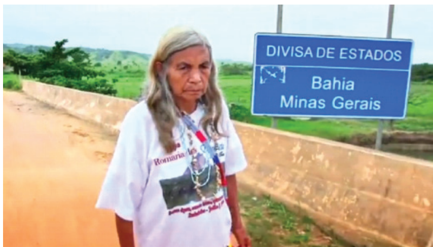
Imagem 3: Trecho do filme em que Dona Delcida cruza a fronteira entre os estados de Minas Gerais e Bahia: uma imagem que materializa como o território que o povo Maxakali transitava não era dividido e sim fluido, fazendo parte de suas vivências.

sistema percebido no seio do qual um sujeito se sente “em casa”. O território é sinônimo de apropriação, de subjetivação fechada sobre si mesma. Ele é o conjunto de projetos e representações nos quais vai desembocar, pragmaticamente, toda uma série de comportamentos, de investimentos, nos tempos e nos espaços sociais, culturais, estéticos, cognitivos. (GUATTARI & ROLNIK, apud SELLIGMANN-SILVA, 2004, p. 121/122)